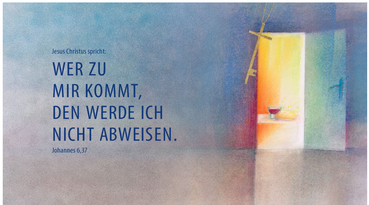
Die offene Tür.

Motiv von Stefanie Bahlinger, Mössingen, www.verlagambirnbach.de