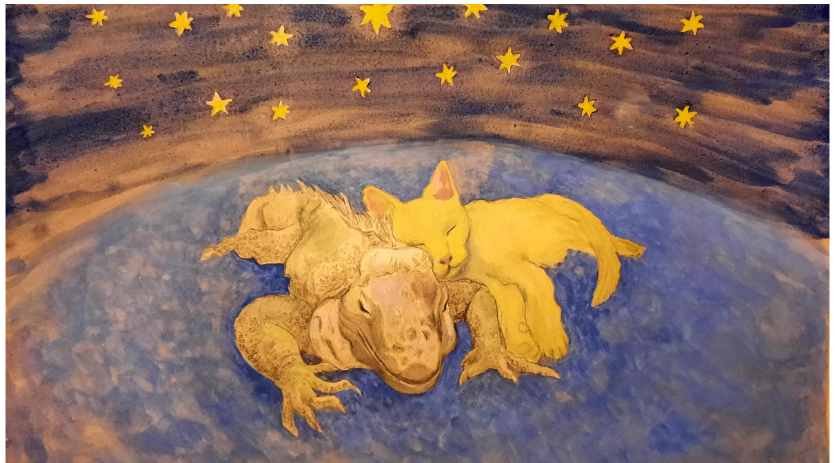
Katze und Leguan