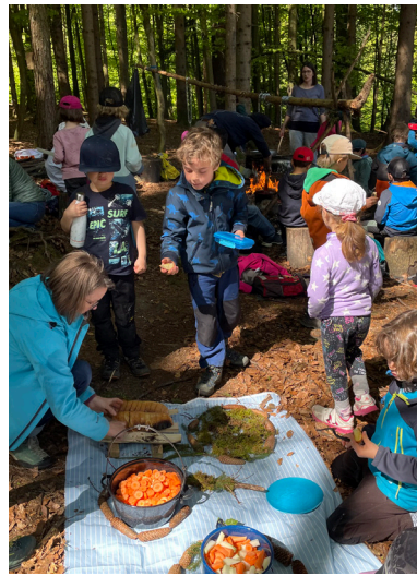
Waldzmittag: Es ist angerichtet.

Die Kinder erfuhren, was es mit Moses Hirtenstab auf sich hat, welche Bedeutung Wasser fürs Leben und in der Taufe hat und dass Essen in der Bibel sehr oft vorkommt. Sie