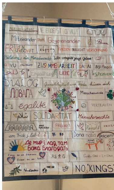
«Frieden ist Handarbeit». Der Friedensteppich wurde erstellt von Menschen unterschiedlicher Herkunft.