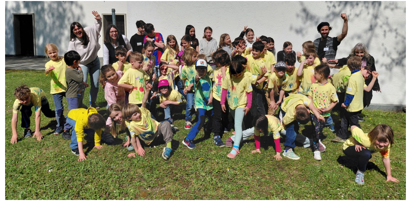
Auf die Plätze, fertig, los: Kinderwoche!

entdeckten Schätze in der Bibel und geheimnisvolle Orte in und unter unserer Kirche und kreativ ging es ebenfalls zu: Es wurden T-Shirts mit bunten Kakteen und Kamelen gestaltet, ein Feuer neben einer Nomadenjurte gemacht und eigene Wanderstäbe hergestellt.