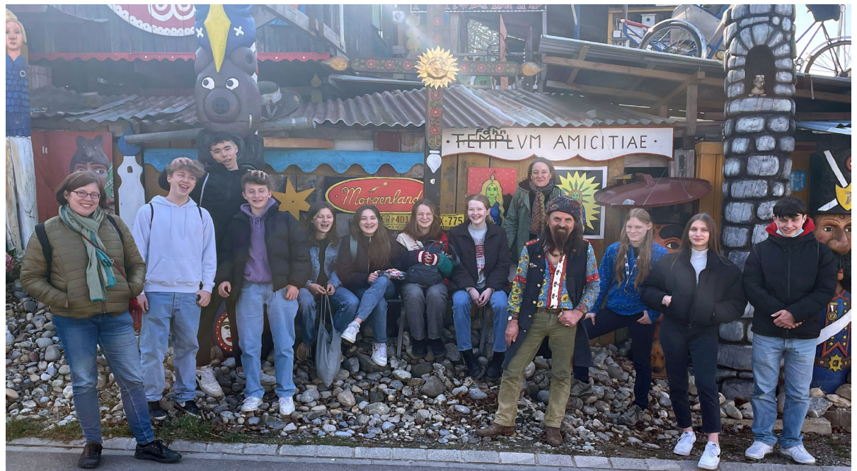
KonfirmandInnen auf dem Ausflug ins Morgenland