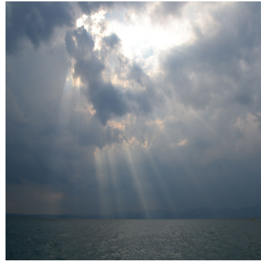
Trotz aller dunklen Wolken – das Licht bricht durch, Foto: flickr.com/zhrefch

Thema und Geschichte: «Klagen ist allzu menschlich»