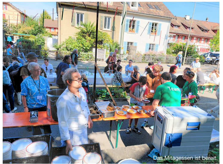
Das Mittagessen ist bereit.