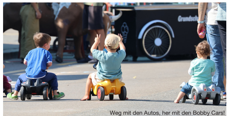
Weg mit den Autos, her mit den Bobby Cars!