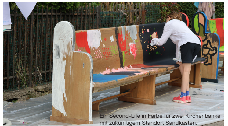
Ein Second-Life in Farbe für zwei Kirchenbänke mit zukünftigem Standort Sandkasten.