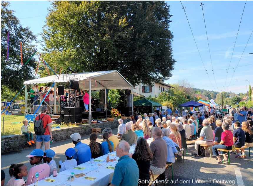
Gottesdienst auf dem Unteren Deutweg