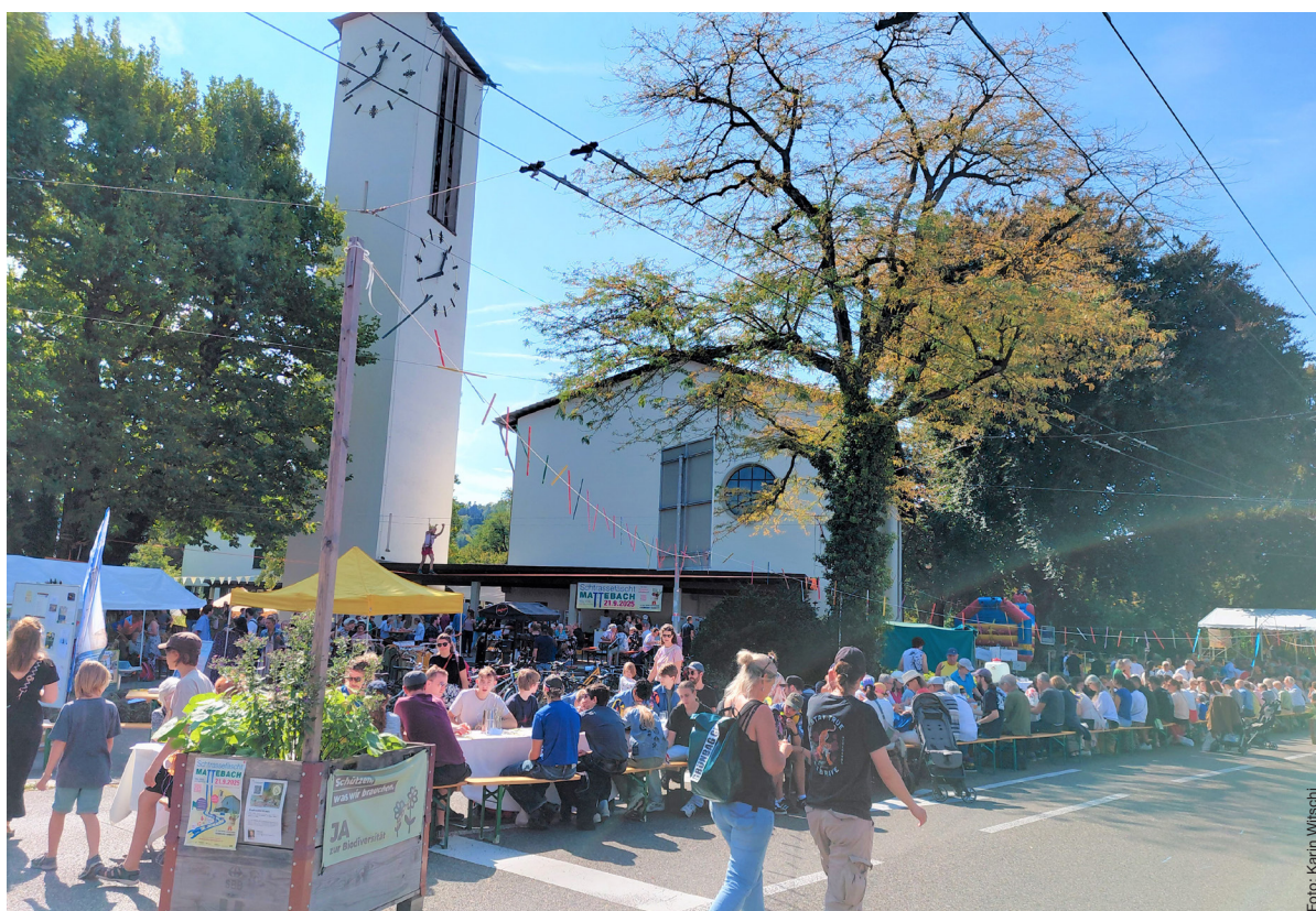
Dreigangmenü statt Durchgangsverkehr: Das Foodsave Bankett auf dem Unteren Deutweg.

9.30 Uhr Gottesdienst zum 1. Advent mit Pfr. Markus Ehrat und Rebekka Hofer (Orgel / Flügel).