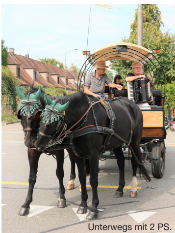
Unterwegs mit 2 PS.