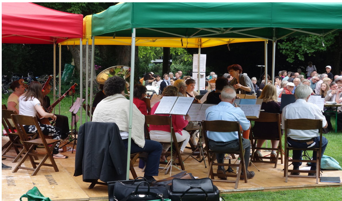
Gelungener Auftritt am Albanifest-Gottesdienst

Veranstalter «Winterthurer Kirchen am Albanifest»: Ev.-ref. Kirchgemeinden; röm.-kath. Pfarreien; christkath. Kirche; evang.-meth. Kirche; Arche Winti. Unterstützt durch die AGCKWi, Arbeitsgemeinschaft Christlicher Kirchen in Winterthur.