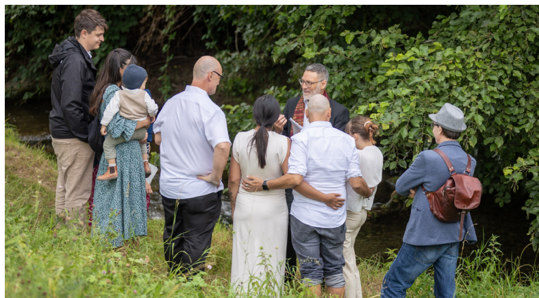
Openair-Taufe an der Eulach anlässlich des Tauffestes 2024.