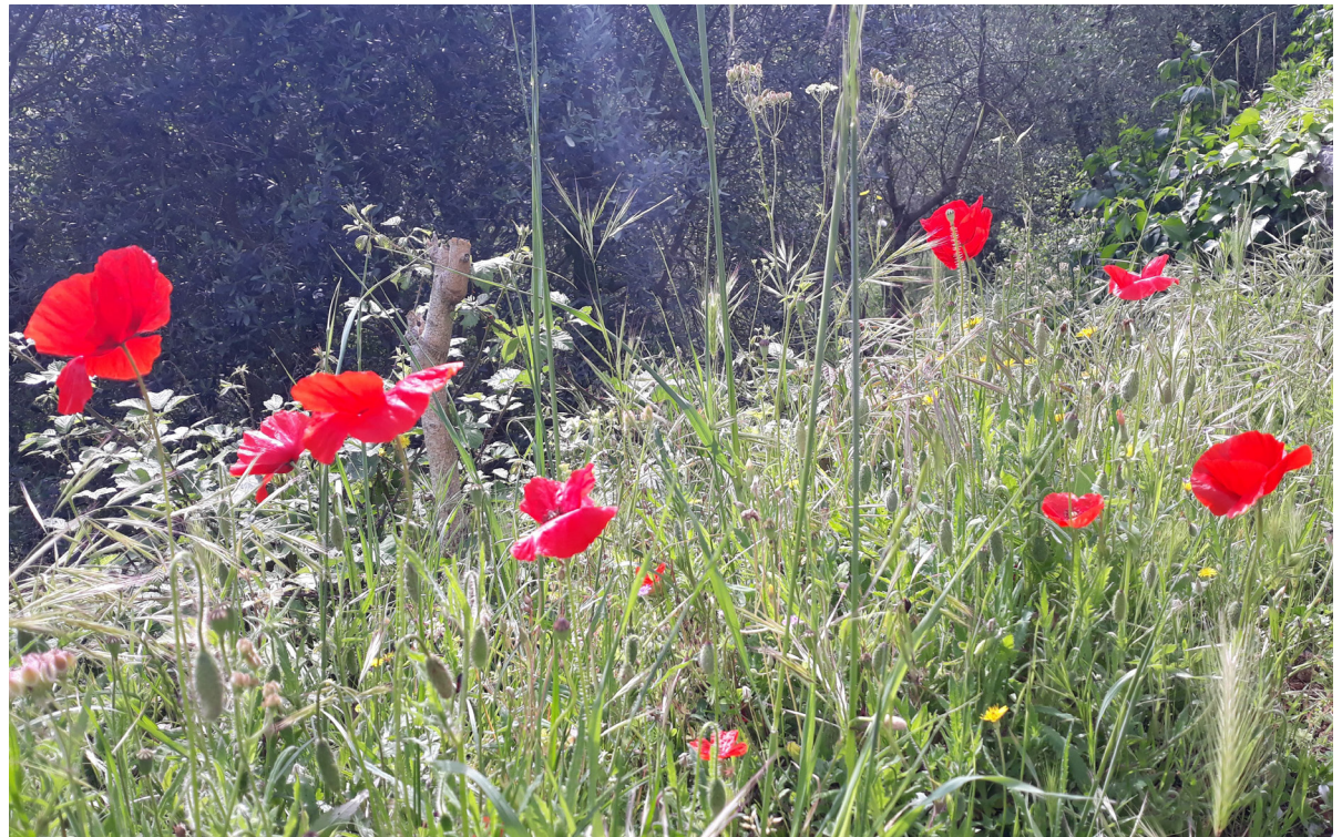
Mohn in den Pisaner Bergen, Toskana

9.30 Uhr Gottesdienst mit Vertretung Kollekte: Hilfe in unserer Gemeinde