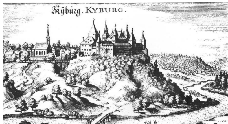
Bild: Kupferstich aus Merian Topographia Helvetiae 1654

Weiteres Pilgerdatum 2021: Dienstag, 5. Oktober, 13.00 – 18.00 Uhr