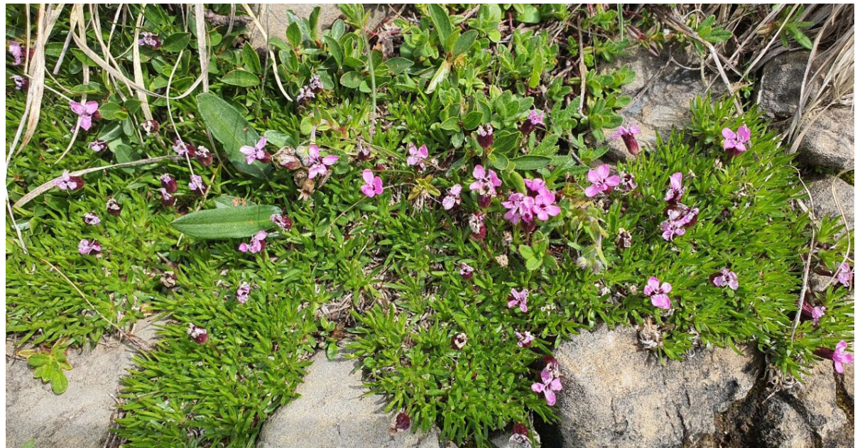
Bergsommer am Brienzer Rothorn.