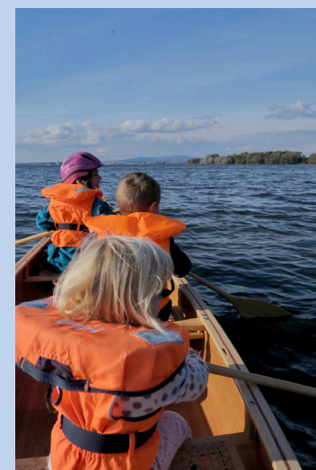
Kleine und grosse Abenteuer in der Gemeindeferienwoche

Danke für eine Rückmeldung an: Claudio Hess, Sozialdiakon claudio.hess@reformiert-winterthur.ch