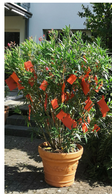
Ein farbig leuchtender Oleander mit vielen lieben, guten Wünschen :)