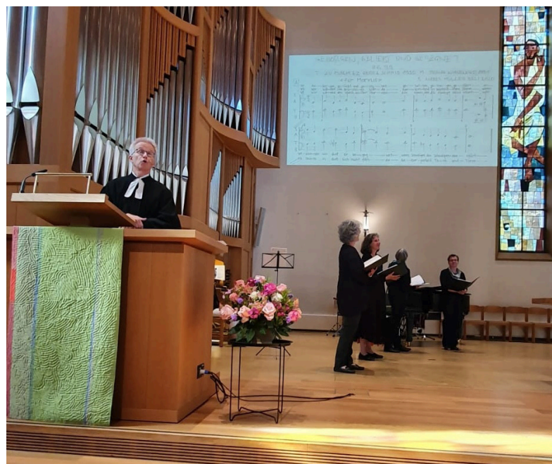
Gottesdienst zum Thema: «Wir wissen nicht, wohin du gehst.» (Joh 14, 1 – 9)

lateinisch im doppelten Sinne übersetzbar: «verdient» und «ausgedient» :)