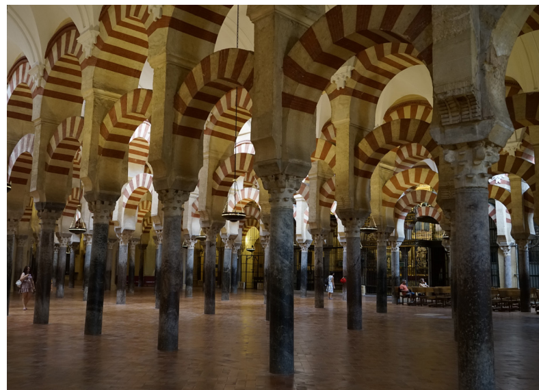
Mezquita Córdoba, älteste Moschee Spaniens