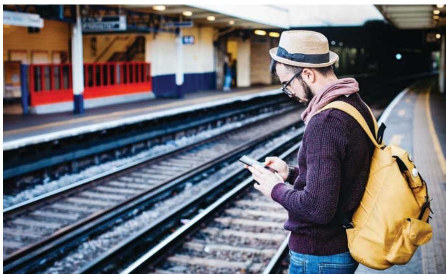
Was sucht, fragt und liest dieser Reisende? Wohin ist er unterwegs?

Nach den üblichen Gottesdiensten: «Chilekafi» im Treffpunkt