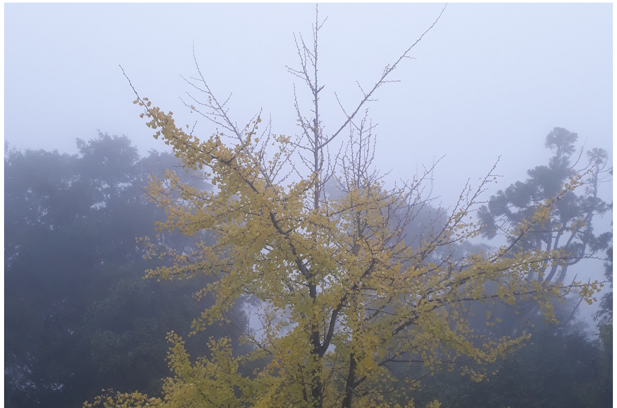
Auf dem Pilgerweg zum Berg Miso, Japan

Nach den üblichen Gottesdiensten sind Sie herzlich zu Getränken im ZwingliSaal eingeladen.