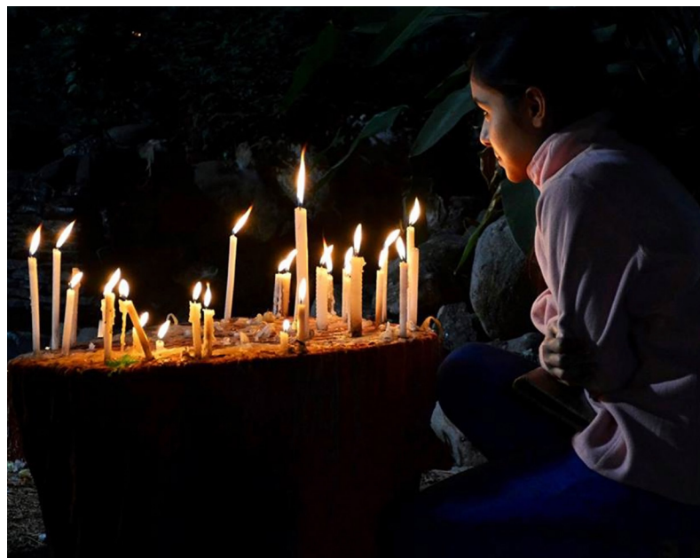
Staunen, dass uns Gottes Licht irdisch, menschlich leuchtet!

Zur Feier des Abendmahls am Weihnachtsmorgen: s. untenstehende Publikation.